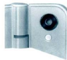
Particolare della ranelle con sede conica